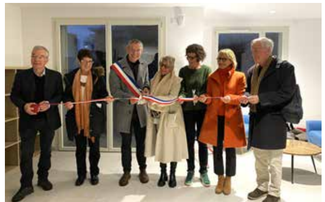
→ Le local commun a été inauguré le 3 décembre dernier.