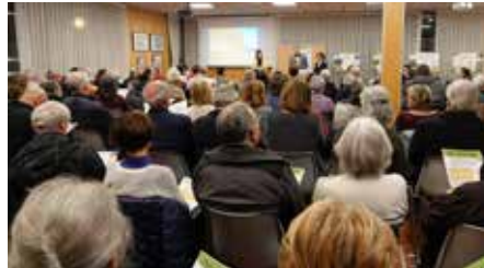
➔ Après 9 mois de concertation, une réunion publique a permis de partager les résultats devant une salle comble.

En 2018, la Faculté de pharmacie déménage sur le site du CHU de Grenoble à La Tronche. L'Etat, propriétaire, vend les terrains en 2019 à l'Etablissement public foncier local du Dauphiné (EPFL-D) avec une obligation de produire du logement social. Soucieuse de respecter ses engagements tout en préservant la qualité de vie, la Ville décide de s'engager dans une démarche de réflexion associant habitants et usagers, afin de définir les grandes orientations de ce que pourrait devenir ce « morceau de ville ». De janvier à novembre 2025 se déroule la réflexion préalable à l'aménagement de la Serve, avec l'accompagnement des agences d'urbanisme et de paysagisme Ville Ouverte et Atelier Iris Chervet.