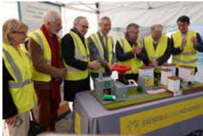
→ Lancement de la première saison de chauffe le 7 octobre dernier en présence de l'ensemble des acteurs !

D'ici 2026, la troisième et dernière phase des travaux permettra en effet de connecter au réseau la future Maison des solidarités, l'école Grand-Pré / Buclos, les gymnase et collège des Buclos, ainsi que la résidence Pré-Blanc et les logements alentours.