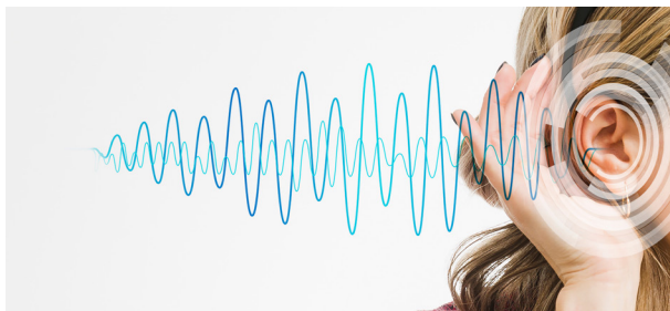
Table ronde et concert J'entends trop... ou pas assez ? Vivre dans un monde sonore