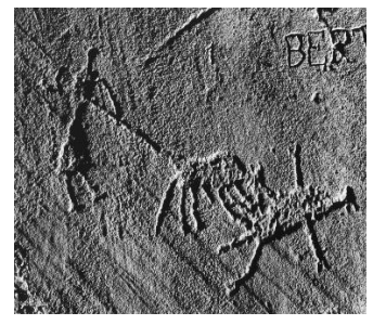
Gravure rupestre d'Aussois