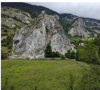
Rocher des amoureux