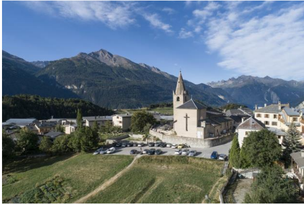
Aussois - son église baroque