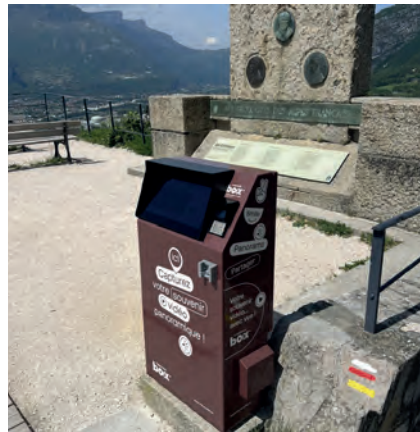
→ La première borne pilote a été installée à la Bastille, en partenariat avec la Régie du Téléphérique de Grenoble.

Pour mieux exploiter son potentiel commercial, le jeune ingénieur décidait en 2021 de lancer E-motion, entreprise intégralement dédiée à cette technologie, avec Skaping en tant qu'associé sous-traitant.