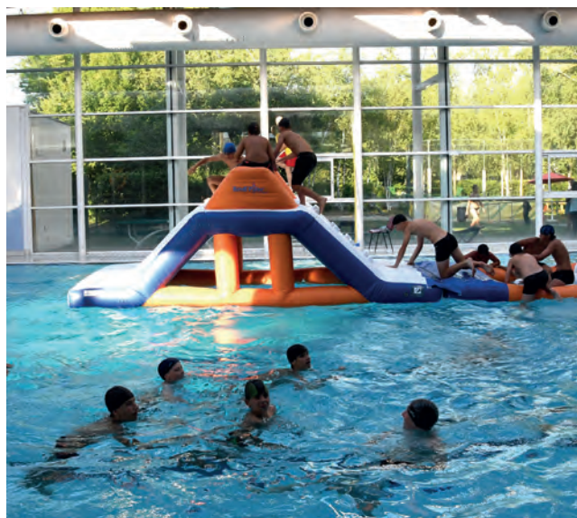
→ La Pool Party, un moment festif réservé aux 13-17 ans !

Sur place, une buvette tenue par les sapeurs-pompiers de Meylan permettra de se rafraîchir et de profiter pleinement de la soirée, tandis que l'association Horizons proposera des jeux en bois pour partager des moments simples et intergénérationnels.