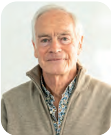
Pascal Olivieri 9 e adjoint délégué à la transition écologique, à la condition animale, à la prévention des risques