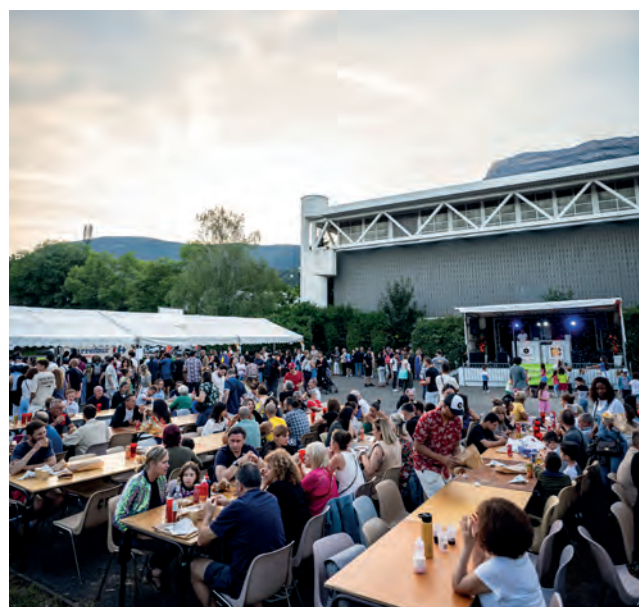
→ Après le traditionnel feu d'artifice, le bal constituera le 2 e moment fort de la célébration du 14 juillet.

→ Pool Party : entrée gratuite à la piscine des Buclos en échange d'une boisson et/ou d'un plat salé/sucré (pizza, quiche, tarte, gâteau... ) de 19h30 à 20h30. Sortie des bassins à 22h.