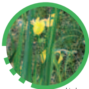
Iris des marais

C'est un Espace Naturel Sensible (ENS) local, labellisé en 2004 par le Conseil général de l'Isère, dans le cadre du Schéma départemental des ENS. Ce classement spécifique vise deux objectifs : la préservation écologique du site et l'accueil du public pour la découverte de la nature. L'accès au plan d'eau se fait par divers cheminements et des ambiances tour à tour agricoles et forestières, qui isolent le promeneur de l'environnement urbain pourtant proche.