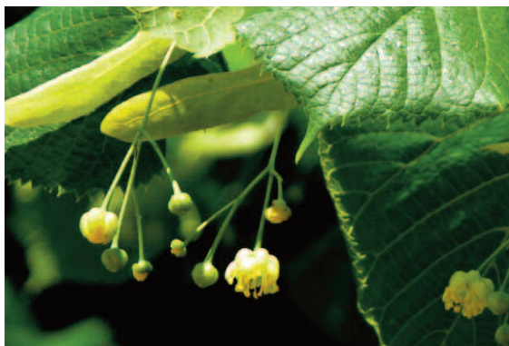
Feuille de tilleul

Si les essences majoritaires appartiennent aux genres érable, tilleul, chêne, peuplier et frêne, Meylan reste caractérisé par une grande diversité d'essences.