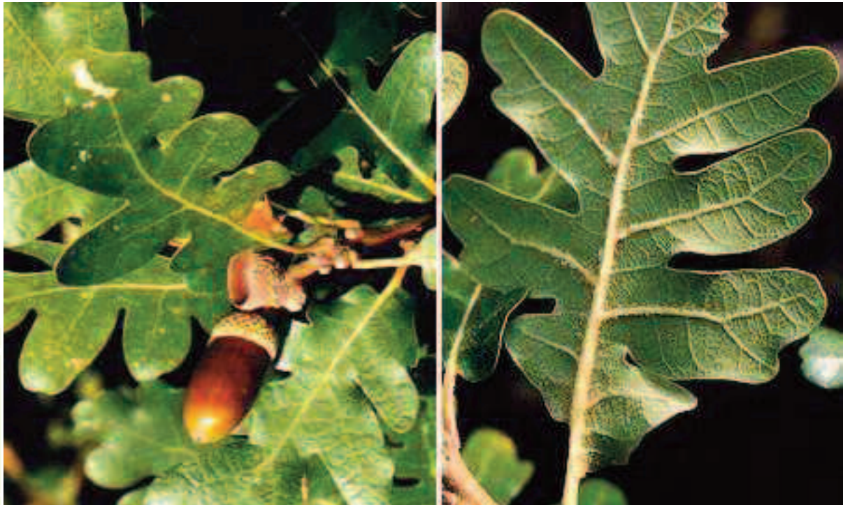
Glands et feuilles de chêne pubescent

La grande diversité des boisements et des essences offre à Meylan des ambiances très contrastées du nord au sud de la commune. Relativement jeunes, ces arbres doivent faire l'objet d'une grande attention pour pérenniser ce paysage.