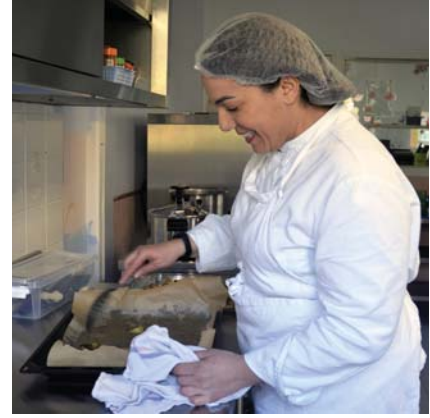
→ 4 crèches possèdent leur cuisine où s'élaborent de bons petits plats.