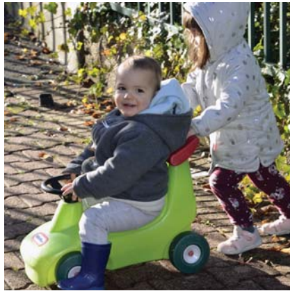
→ Sortir les enfants en extérieur chaque jour : une des volontés des équipes de professionnels.