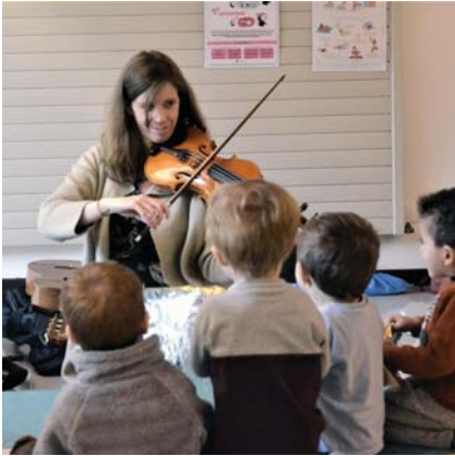
→ Un Projet musique et petite enfance, avec le CRC, a débuté en 2021. Il propose un moment privilégié autour de la musique.