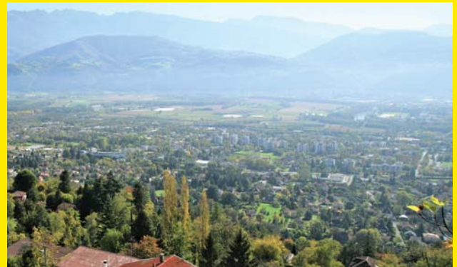
➔ Dans le cadre de la modification n°1 du PLUi, la Ville a obtenu la prise en compte d'une mixité sociale plus équilibrée et la préservation de son identité « ville parc ».

Elle a donc demandé et obtenu dans cette modification le renforcement de la préservation du patrimoine végétal et cultivé, la protection du bâti dans sa diversité, en tenant