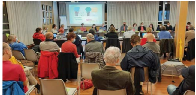
→ L'Heure citoyenne, rendez-vous qui participe à la vie démocratique de la commune, a été mise en place en septembre 2020.

Depuis septembre 2020, chaque conseil municipal s'interrompt à 19 h 30, pour une heure de partages et d'échanges sur un sujet donné entre élus et citoyens. Baptisé L'Heure Citoyenne, ce rendez-vous est un temps fort de la démocratie participative, voulu par l'équipe municipale.