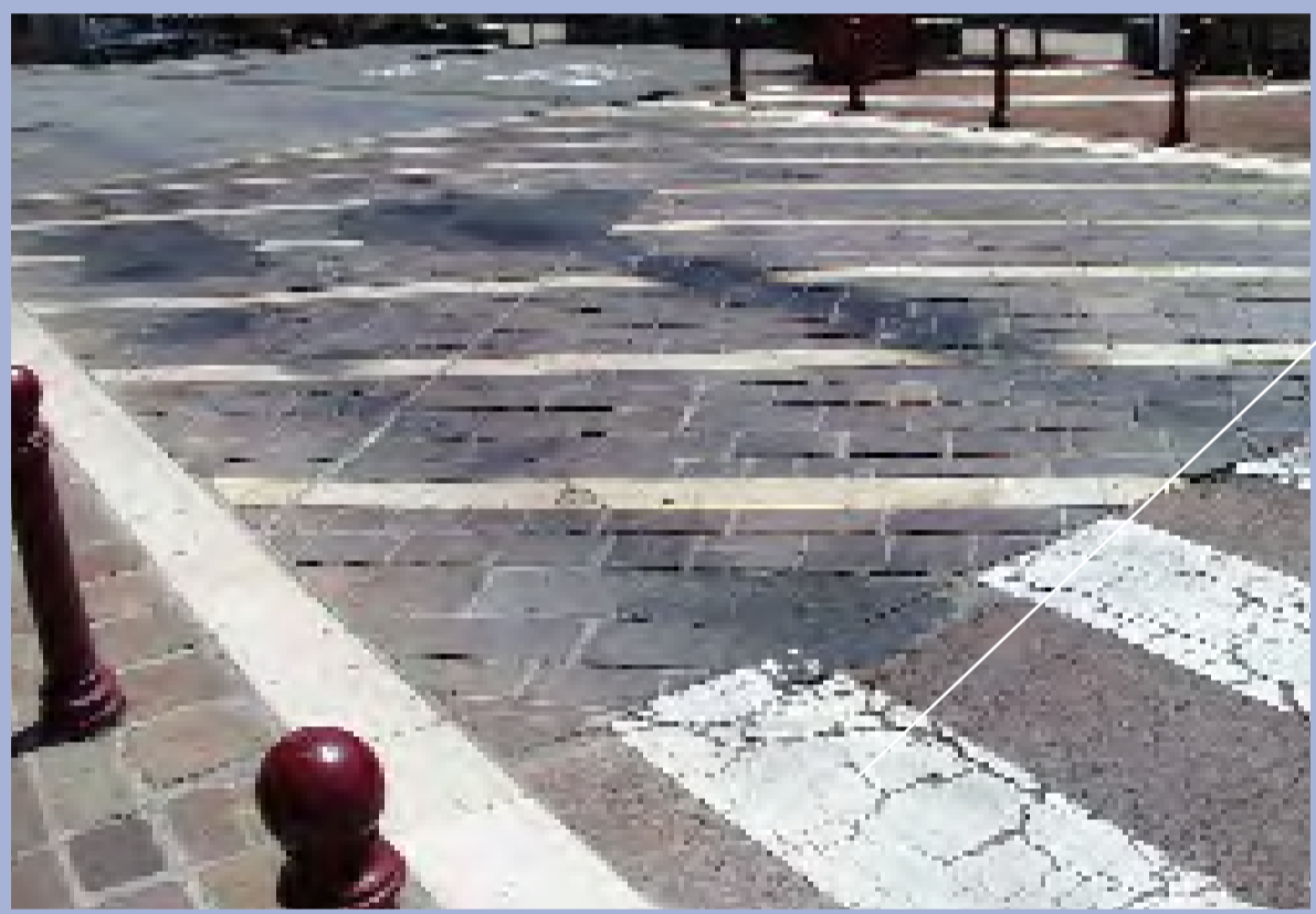
Mauvais état de la traversée