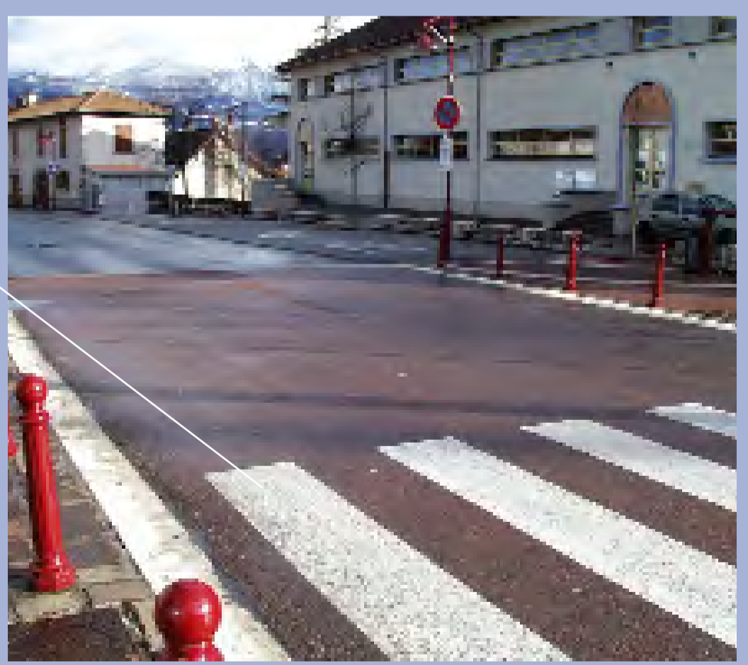
Reprise de la surface pour faciliter la traversée